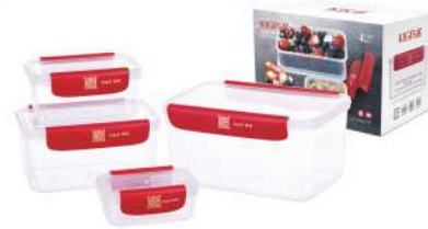
型号: APS4 四件套 产品尺寸: 220×150×150 mm / 8.7×5.9×5.9 in 装箱数: 16 sets 外箱尺寸: 61.5×46.5×32 cm / 24.2×18.3×12.6 in 详述: AP11(180ml) AP22(480ml) AP33(1100ml) AP44(2150ml)