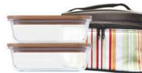
型号: BGS052-A 二件套 产品尺寸: 240×160×138mm / 9.4×6.3×5.4 in 装箱数: 8 sets 外箱尺寸: 49.5×35.5×30cm / 19.5×14×11.8 in 详述: BHG031(1040ml×2)