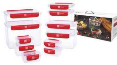
型号: APS11 十一件套 产品尺寸: 265×170×250 mm / 10.4×6.7×9.8 in 装箱数: 8 sets 外箱尺寸: 55×36×52.5 cm / 21.7×14.2×20.7 in 详述: AP11(180ml×4) AP22(480ml) AP31(500ml) AP33(1100ml) AP42(1200ml) AP44(2150ml) AP53(2450ml) AP57(5380ml)