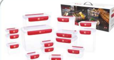
型号: APS13 十五件套 产品尺寸: 370×170×340 mm / 14.6×6.7×13.4 in 装箱数: 6 sets 外箱尺寸: 53×39×70 cm / 20.9×15.4×27.6 in 详述: AP11(180ml×5) AP13(430ml×2) AP22(480ml×2) AP25(1050ml) AP28(1650ml) AP31(500ml) AP33(1100ml) AP44(2150ml) AP57(5380ml)