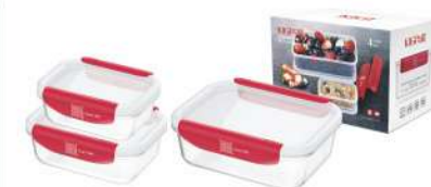
型号: APS16 三件套 产品尺寸: 220×175×200 mm / 8.7×6.9×7.9 in 装箱数: 8 sets 外箱尺寸: 46×37×42 cm / 18.1×14.6×16.5 in 详述: AG11(370ml) AG12(640ml) AG13(1040ml)