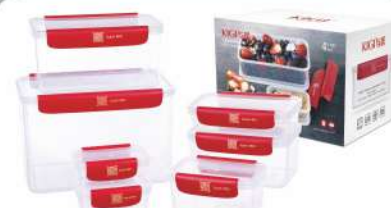
型号: APS7 七件套 产品尺寸: 265×170×210 mm / 10.4×6.7×8.3 in 装箱数: 9 sets 外箱尺寸: 53×28.5×64 cm / 20.9×11.2×25.2 in 详述: AP11(180ml×2) AP22(480ml) AP31(500ml) AP33(1100ml) AP44(2150ml) AP57(5380ml)