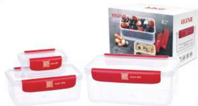
型号: APS2 三件套 产品尺寸: 220×150×100 mm / 8.7×5.9×3.9 in 装箱数: 20 sets 外箱尺寸: 46.5×32×52 cm / 18.3×12.6×20.5 in 详述: AP11(180ml) AP32(800ml) AP43(1650ml)