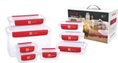
型号: APS9 八件套 产品尺寸: 265×170×190 mm / 10.4×6.7×7.5 in 装箱数: 9 sets 外箱尺寸: 53×28.5×59 cm / 20.9×11.2×23.2 in 详述: AP11(180ml×3) AP22(480ml×2) AP31(500ml) AP42(1200ml) AP56(4500ml)