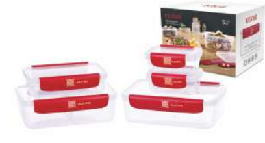
型号: APS5 五件套 产品尺寸: 220×150×170 mm / 8.7×5.9×6.7 in 装箱数: 16 sets 外箱尺寸: 61.5×46.5×36 cm / 24.2×18.3×14.2 in 详述: AP11(180ml×2) AP31(500ml) AP42(1200ml) AP42R(1150ml)