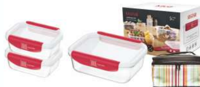
型号: APS15 三件套 产品尺寸: 245×170×160 mm / 9.6×6.7×6.3 in 装箱数: 8 sets 外箱尺寸: 51×35×34 cm / 20.1×13.8×13.4 in 详述: AG11(370ml×2) AG13(1040ml)