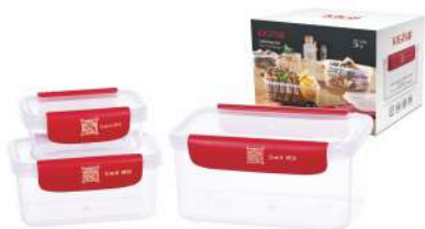
型号: APS3 三件套 产品尺寸: 182×126×100 mm / 7.2×5×3.9 in 装箱数: 30 sets 外箱尺寸: 56×27×52 cm / 22×10.6×20.5 in 详述: AP11(180ml) AP22(480ml) AP33(1100ml)