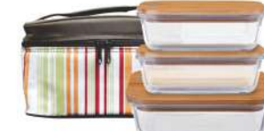
型号: BGS052-C 三件套 产品尺寸: 240×160×138mm / 9.4×6.3×5.4 in 装箱数: 8 sets 外箱尺寸: 49.5×35.5×30cm / 19.5×14×11.8 in 详述: BHG011(370ml×2) BHG031(1040ml)